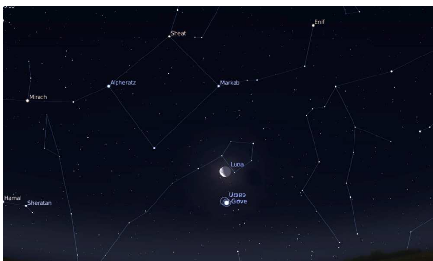
Congiunzione Giove-Urano-Luna del 6 giugno ore 3:30