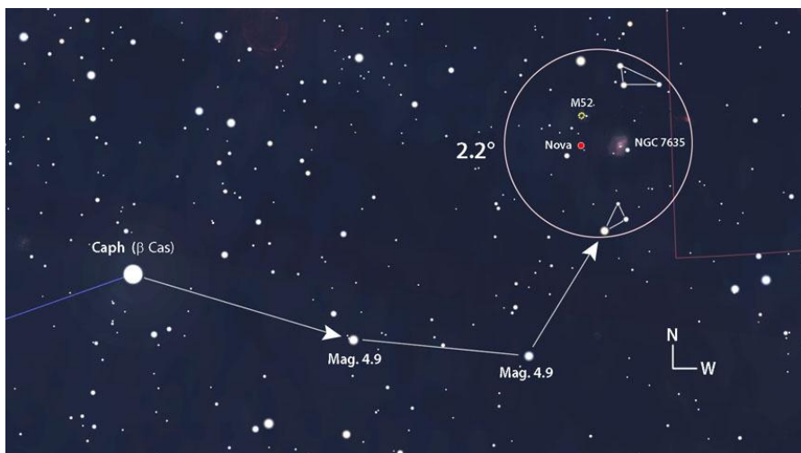
Cartina realizzata da Bob King con Stellarium (da Sky and Telescope ). L'Autore suggerisce di sfruttare i due asterismi triangolari per facilitare l'identificazione della V1405 Cas nel cerchio con diametro di 2.2°.

«Le novae – scrive Bob King – sono entusiasmanti da guardare [...] anche perché assisti a un processo essenziale che fa funzionare l'universo. Attraverso la fusione esplosiva, la nova semina lo spazio con carbonio, azoto, ossigeno e altro ancora. [...] Alcuni dei tuoi stessi atomi potrebbero aver avuto origine in un evento catastrofico simile, molto lontano e molto tempo fa».