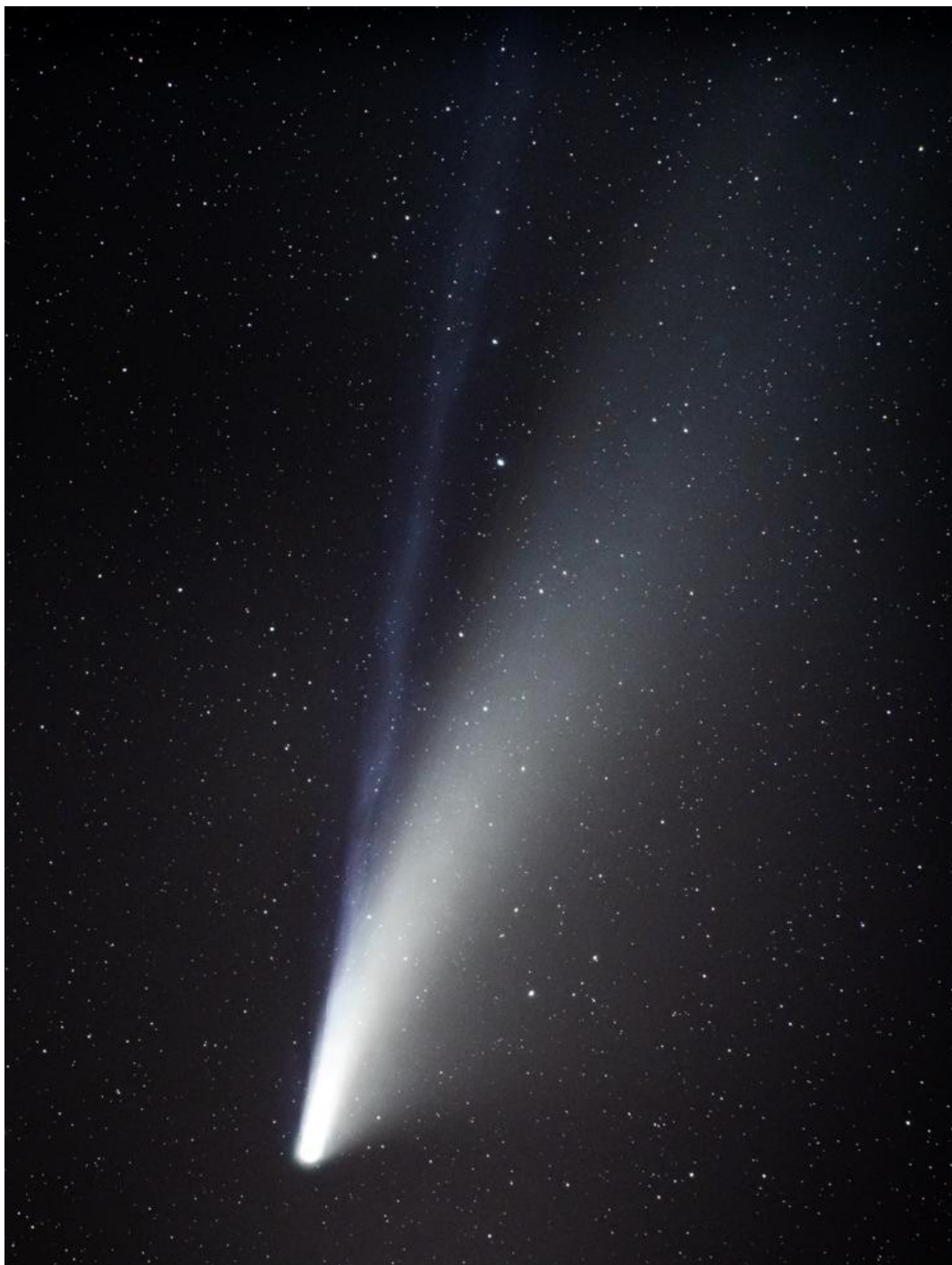
Cometa NEOWISE (C/2020 F3), ripresa 20 luglio 2020, alle 22:11:38 CEST, presso la Capanna Mollino nel comune di Sauze d'Oulx, a 2200 m slm, in zona buia ed aperta, con fotocamera Nikon D850 su cavalletto Manfrotto 190 carbon, inseguitore Ioptron Skyguider Pro (piccolo astroinseguitore leggero da cavalletto), 7 pose da 60 secondi a 800 ISO, focale 200 mm, apertura f/2.8, obiettivo Nikon 70-200.