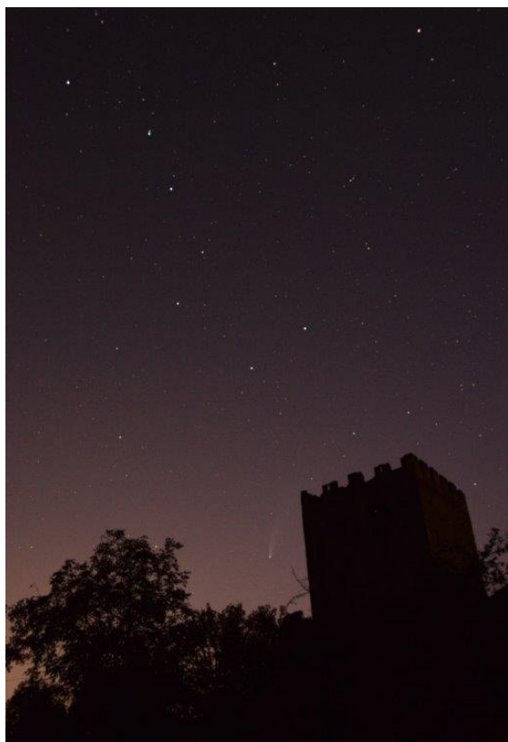
Cometa NEOWISE (C/2020 F3) il 20 luglio 2020 alle ore 22:47 CEST, presso il Castello di Mattie (TO), 700 m slm circa, con Nikon D5300, obiettivo AF-S DX Nikkor 18-200mm f/3.5-5.6, 22mm, 20 s, f/6.3, ISO 3200.

Tutto è mio, niente mi appartiene, nessuna proprietà per la memoria, e mio finché guardo. [...]