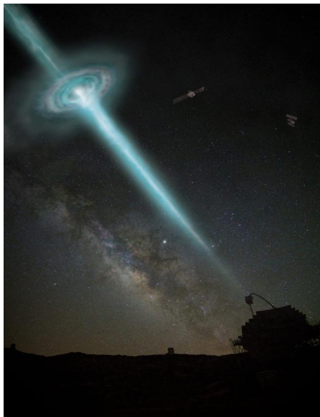
Immagine artistica di GRB 190114C visto da Terra e dallo spazio.