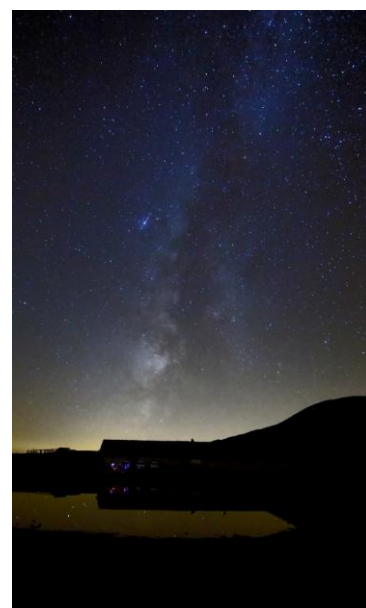
A sinistra, le Pleiadi si specchiano nel piccolo lago di fronte al Rifugio; a destra, la Via Lattea si staglia sopra al Rifugio (7-8 settembre 2018). Fotocamera Canon EOS 60D, fisheye 14 mm, 30 s, 1600 ISO (a sinistra) e 3200 ISO (a destra), posa fissa su treppiede.