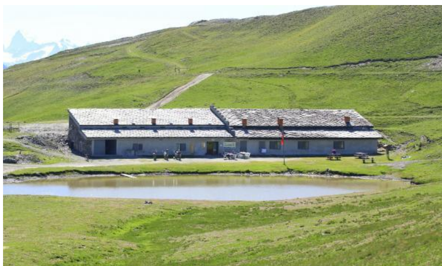
Rifugio Casa Assietta.

Saranno messe a disposizione prese per corrente elettrica e bevande calde; la struttura permetterà il rientro a qualsiasi ora della notte; le auto con le attrezzature ingombranti possono arrivare fino davanti al Rifugio.