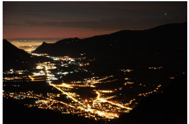
Luci della Valle di Susa e di Torino viste dal Sollietto, località a 1500 m slm sulle pendici del monte Roccamelone, poco prima dell'alba del 1° febbraio 2016. In alto a destra, il pianeta Venere.

Inquinamento luminoso e fauna: problemi e soluzioni