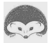
Stazione Teriologica Piemontese