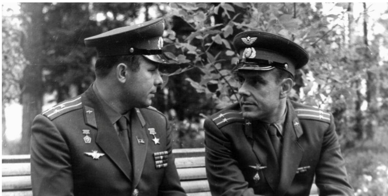
Yuri Gagarin e Vladimir Komarov nel 1964 nella Città delle Stelle, Mosca.