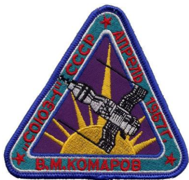
Il logo della missione Soyuz 1.