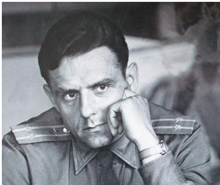
Vladimir Michajlovič Komarov (1927-1967)

Cinquant'anni fa, il 24 aprile 1967, moriva Vladimir Michajlovič Komarov (Владимир Михайлович Комаров) rientrando dallo spazio a bordo della Soyuz 1. Il lancio era avvenuto il giorno prima e 24 ore più tardi doveva avvenire il lancio della Soyuz 2 con tre astronauti a bordo (due avrebbero dovuto effettuare una passeggiata spaziale verso la Soyuz 1), ma il volo fu annullato per i problemi tecnici che si erano manifestati sulla prima navicella. Infatti, appena raggiunta l'orbita terrestre, uno dei due pannelli solari non si era aperto e non era stato neppure possibile orientare correttamente la navicella verso il Sole. Inoltre i collegamenti radio erano possibili solo con frequenza VHF (quindi solo quando la capsula sorvolava il territorio sovietico), perché i trasmettitori ad onde corte presentavano problemi nel funzionamento.