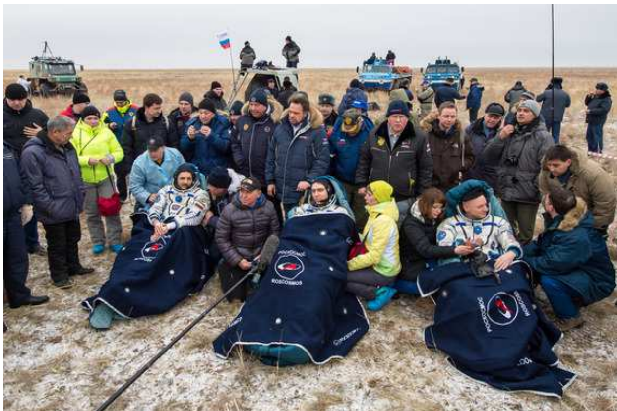
Mikhail Kornienko, Sergey Volkov e Scott Kelly (da sinistra) dopo il rientro a Terra dalla Stazione Spaziale Internazionale.

Oggi, 2 marzo 2016, alle 10:26 locali (le 5:26, ora italiana) è rientrata in Kazakistan, non lontano dalla città di Zhezkazgan, la Soyuz TMA - 18M. A bordo i cosmonauti Mikhail Kornienko e Sergey Volkov e l'astronauta Scott Kelly. Kelly e Kornienko, partiti il 27 marzo 2015, hanno completato una missione sulla Stazione Spaziale Internazionale (ISS) durata circa un anno (340 giorni consecutivi): sono state effettuate quasi 400 indagini per indagare le reazioni del corpo umano all'assenza di peso, all'isolamento, alle radiazioni e allo stress dei voli spaziali di lunga durata, in previsione di missioni su Marte. Da Terra ha partecipato ad alcuni studi il fratello gemello identico di Kelly, l'ex-astronauta Mark Kelly. Con la fine di questa missione, Kelly ha trascorso in totale 520 giorni nello spazio in quattro missioni, e Kornienko 516 giorni in due missioni.