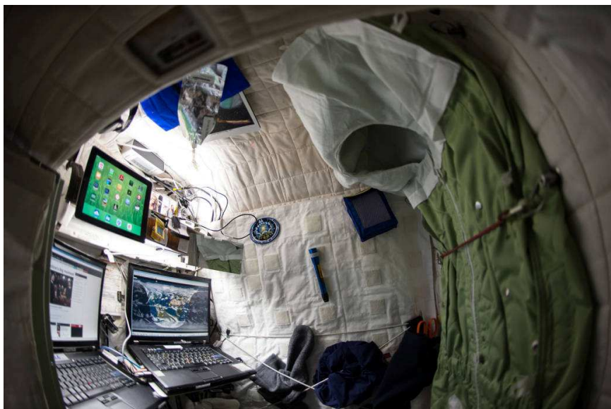
Scott Kelly: "la mia camera a bordo della ISS: Tutti i comfort di casa. Ebbene, la maggior parte".