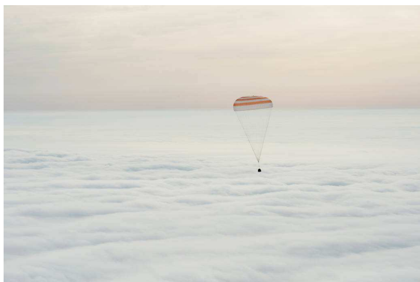
Il rientro della Soyuz TMA - 18M.